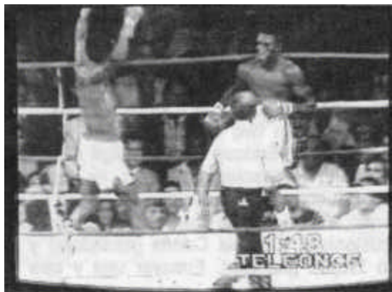
"La Historia de la física" -1982.

miran. Miradas en tránsito, entonces, y que dejan transitar eso que ellas miran y construyen: lo múltiple .