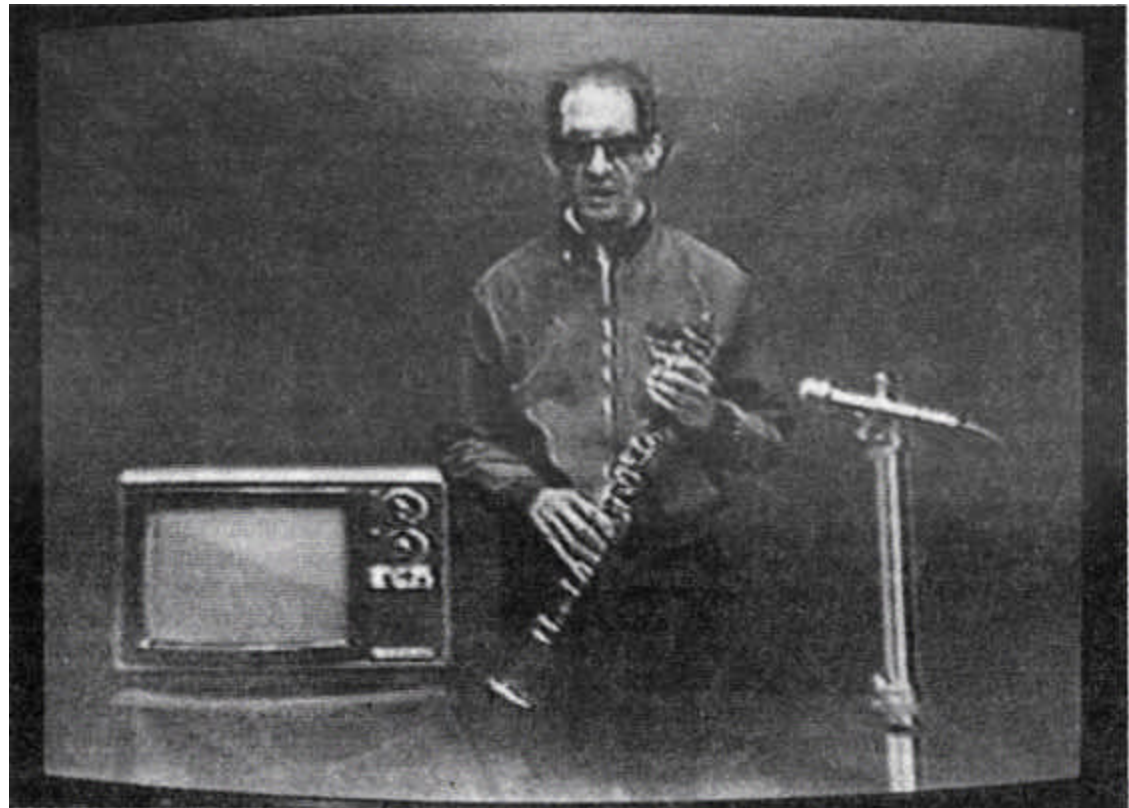
"5 Bocetos preparatorios..." - 1986